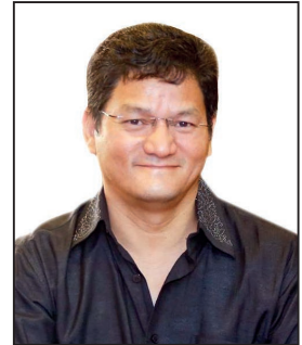
कुशन प्रधान स्वतन्त्र संचालक